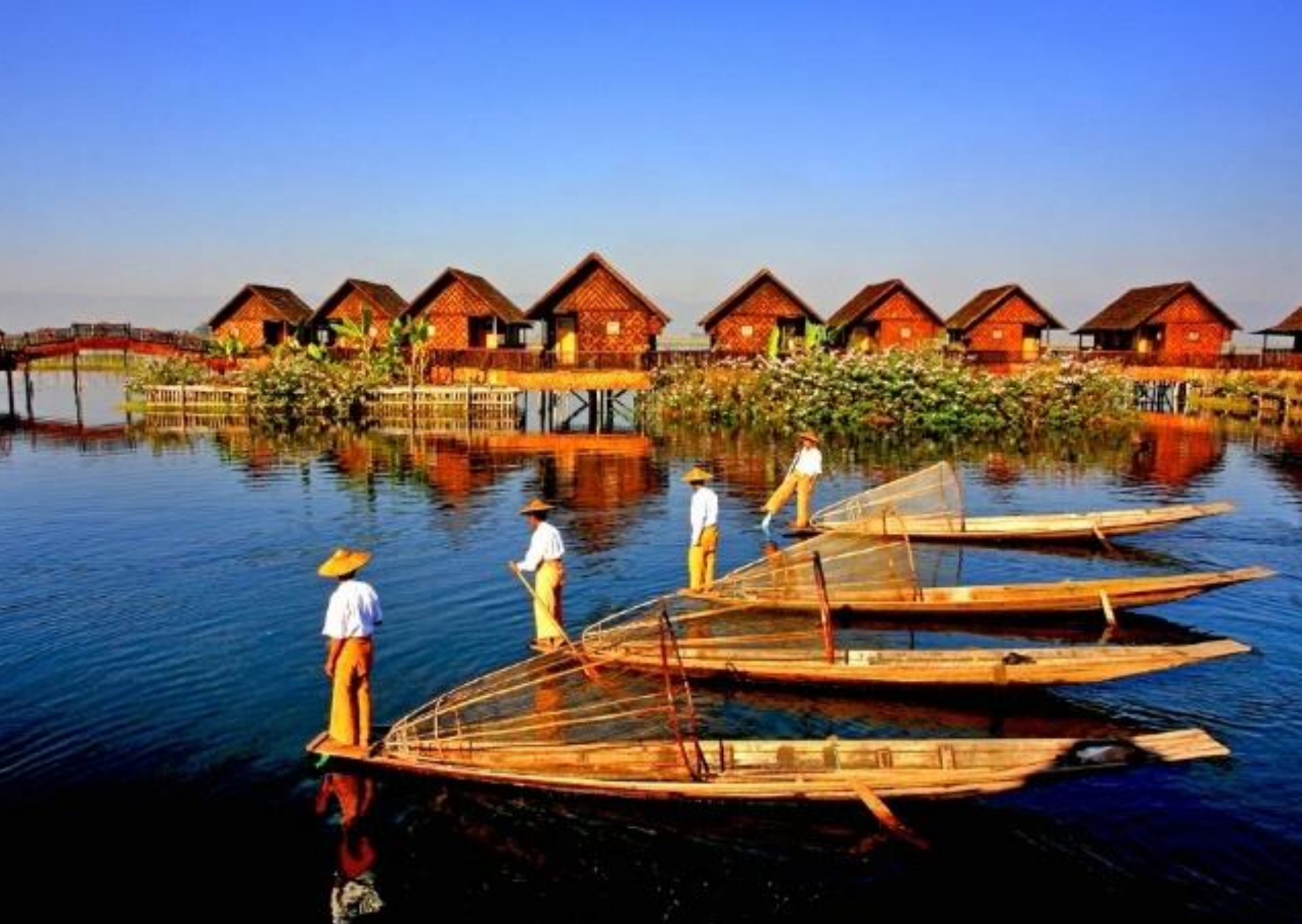
茵萊湖 ( Inle Lake ) 是位在緬甸撣邦撣部高原的湖泊。面積116平方公里，是緬甸有名的觀光地。