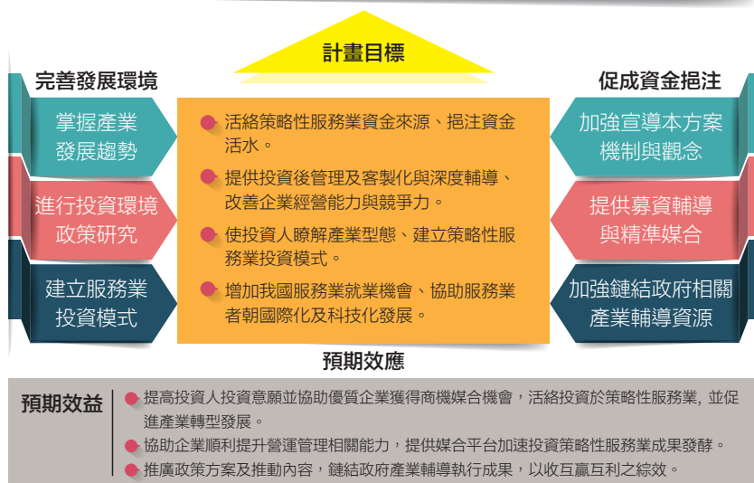
圖2 臺灣加強投資策略性服務業推動計畫內容