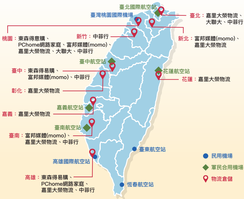
圖4 臺灣國際物流及電子商務產業分布情形

臺灣物流及電子商務產業分布於北中南各地 (圖 4)。其中桃園市擁有國際機場優勢，為臺灣主要電商與國際物流產業聚集地。鄰近區域內已有超過 2,000 間物流、電子商務、跨境電商、智慧系統服務商等業者進駐，每年創造約新臺幣 1,800 億元的產值。隨著產業及相關技術發展越趨成熟，許多業者也逐步以衛星倉儲方式，在各大都會區旁設置小型倉儲物流據點，以提供更好的服務品質。